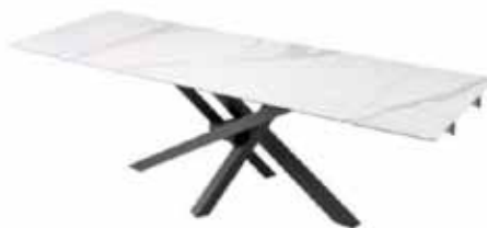
Tavolo Shangai Riflessi

L'articolo di design acquistato da Belen Rodriguez è un tavolo Shangai realizzato dall'azienda Riflessi ed è caratterizzato da un piano di ceramica allungabile con base in alluminio. La base del tavolo è composta da gambe inclinate e sovrapposte tra loro in maniera asimmetrica e con snodo centrale, che è l'elemento centrale dell'arredo. Sopra al tavolo contemporaneo, la showgirl ha fatto installare un lampadario tubolare Stilo , sempre prodotto dall'azienda Riflessi. Il costo del pregiato tavolo in marmo per otto persone nella sua abitazione milanese ha un costo che si aggira intorno ai 5.000 euro . Per la lampada a sospensione, chiamata Stilo 12 , sappiamo che è realizzata da dodici tubolari in metallo verniciato e cromo nero. Nonostante non si conosca con esattezza il prezzo dell'articolo, le lampade dell'azienda non costano mai al di sotto dei 500 euro .