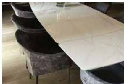
Il tavolo di Belén

caratteristiche della sua abitazione. Si tratta di un appartamento arredato con diversi mobili di design. Di recente ha mostrato il tavolo della zona living della casa caratterizzato da un grande piano bianco con una base scultorea.