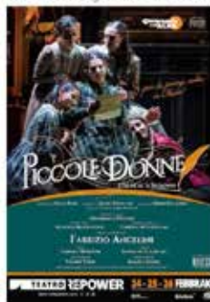
Piccole Donne - 24, 25 e 26 febbraio al Teatro Repower