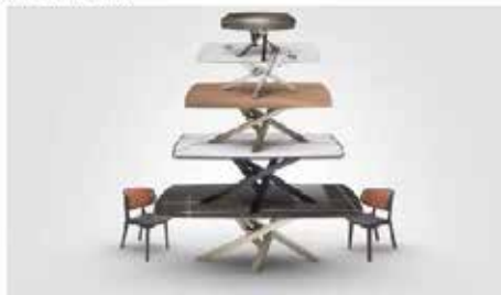
Il tavolo Shangai di Riflessi

Il tavolo nel salotto di Belén Rodriguez è uno degli arredi più iconici del made in Italy. Si tratta del tavolo Shangai dell'azienda Riflessi caratterizzato da un piano in ceramica allungabile e con base in alluminio.