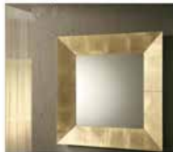
Specchio Royal cornice oro di Riflessi

Per abbracciare il concetto di modernità, nelle cornici dorate moderne sono presenti elementi innovativi, spesso anche high-tech.