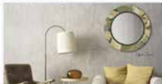
Photo modello specchio con filo oro

Diversi per caratteristiche, struttura, forma e tipologie rispetto ai modelli classici, gli specchi moderni dorati ribaltano letteralmente il concetto tradizionale di cornice lavorata. Si presentano più leggeri, eleganti ma senza rinunciare alla qualità.