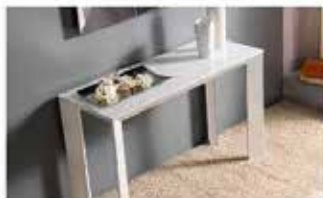
Consolle, colore bianco da 80€

Se infatti la si sta acquistando per avere un piano d'appoggio all'occorrenza, il modello apribile è la scelta ideale. Invece, nel caso in cui si stia semplicemente riempiendo un angolo morto oppure si stia decorando la stanza e basta, può andare bene anche solo il modello fisso.