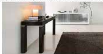
Consolle camera da letto colore nero da 100€

Tuttavia questa regola può subire qualche piccola eccezione in alcuni casi specifici.