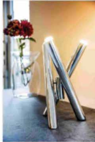
Shangai 7 cm x 40 cm

La lamp per la lampada da spogio Shangai 7 cm x 40 cm è composta da tre tubi in metallo riflettente, con un cavo nella verticale. Le tubi formano un triangolo equilatero che si illumina per riflettere la luce. Il cavo elettrico è nascosto in un tubo nero. Misura di 20 x 40 cm. Prezzo € 1.100 max. www.riflessi.it