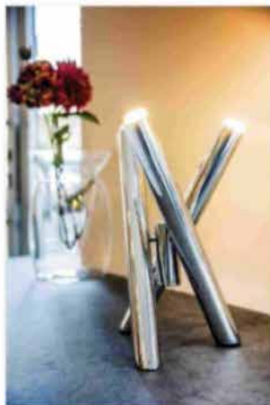
Shangai 7 modelli di Riflessi

Si è già per la lampada di ispirazione Shangai 7 modelli di Riflessi che si ispirano alle forme minimali e moderne. I modelli sono: Shangai 7, Shangai 8, Shangai 9, Shangai 10, Shangai 11, Shangai 12, Shangai 13, Shangai 14, Shangai 15, Shangai 16, Shangai 17, Shangai 18, Shangai 19, Shangai 20, Shangai 21, Shangai 22, Shangai 23, Shangai 24, Shangai 25, Shangai 26, Shangai 27, Shangai 28, Shangai 29, Shangai 30, Shangai 31, Shangai 32, Shangai 33, Shangai 34, Shangai 35, Shangai 36, Shangai 37, Shangai 38, Shangai 39, Shangai 40, Shangai 41, Shangai 42, Shangai 43, Shangai 44, Shangai 45, Shangai 46, Shangai 47, Shangai 48, Shangai 49, Shangai 50, Shangai 51, Shangai 52, Shangai 53, Shangai 54, Shangai 55, Shangai 56, Shangai 57, Shangai 58, Shangai 59, Shangai 60, Shangai 61, Shangai 62, Shangai 63, Shangai 64, Shangai 65, Shangai 66, Shangai 67, Shangai 68, Shangai 69, Shangai 70, Shangai 71, Shangai 72, Shangai 73, Shangai 74, Shangai 75, Shangai 76, Shangai 77, Shangai 78, Shangai 79, Shangai 80, Shangai 81, Shangai 82, Shangai 83, Shangai 84, Shangai 85, Shangai 86, Shangai 87, Shangai 88, Shangai 89, Shangai 90, Shangai 91, Shangai 92, Shangai 93, Shangai 94, Shangai 95, Shangai 96, Shangai 97, Shangai 98, Shangai 99, Shangai 100.