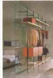
Calina armadio boutique di Eto. Design Piero Lissoni