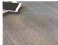
Torino Living collezione Tuffano di Eto. Design Quale