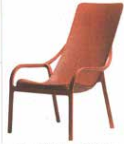
Stella di Designer Sunlight di Eto. Design Quale