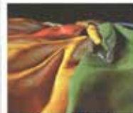
Giardini Louisa di Eto. Design Quale