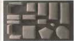
Diretta componibile 7+1 di Tuffo. Design Matteo Spini