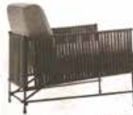
Sofa da Vici di Oney Italia. Design Stefano Spreafico