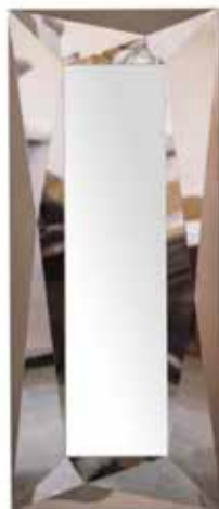
Riflessi, Specchio Diamond

Accanto alla brillantezza e l'uniformità cromatica dell'acciaio specchiante, si distinguono le nuove superfici marmoree naturali ricche di venature, colori e sfumature, proposte per i top di tavoli, tavolini e madie: tra queste, il marmo Patagonia, il marmo Capraia lucido, il marmo Verde Alpi e Verde Borgogna opaco e il marmo Rosso Levanto.