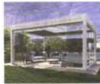
Lounge di Designer Sunlight di Eto. Design Quale