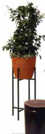
Sul supporto Iron Stand, il VASO in plastica Duna [Tera da € 50,30 il vaso].