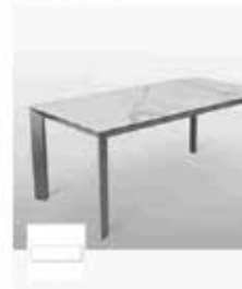
RIFLESSI MANHATTAN - Tavolo allungabile rettangolare in ceramica