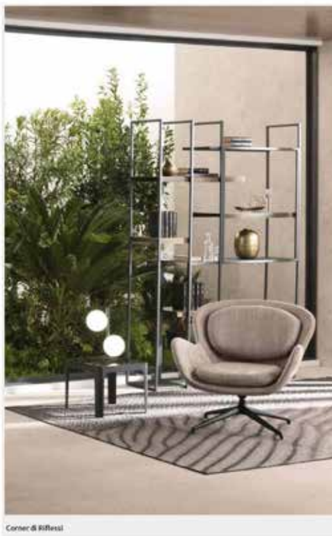
Corner di Riflessi

Una solida struttura geometrica in metallo nella finitura verniciato grafite sorregge il piano quadrato in ceramica del tavolino Corner di Riflessi che ha una linea contemporanea. Il top è caratterizzato da un aspetto che ricorda il marmo scuro con venature in contrasto. Misura L 45 x P 45 x H 45 cm. Prezzo 622 euro. www.riflessi.it