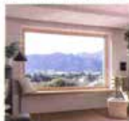
FINESTRA lucida H330 con telaio in alluminio e legno [Internara].

Rivestimenti caldi nelle sfumature della terra, lanto legno e grandi vetrate per far entrare la natura e la luce in casa!