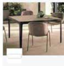
RIFLESSI CROSS - Tavolo quadrato in ceramica