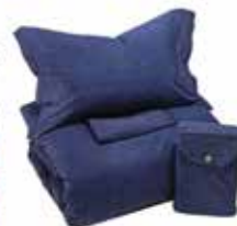
In puro cotone il COMPLETO copriletino Jeans [Caleffi da € 75 il letto singolo].

La versione young del rustico? Abbinata liberamente il tavolo minimalista con la stufa techno-nostalgica, la libreria raw e gli sgabelli fatti coi tronchi!