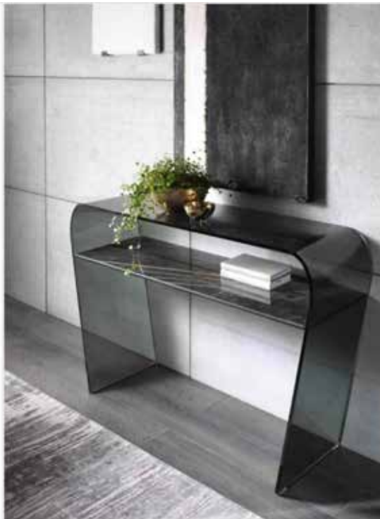
Saphiria di Riflessi

Un pezzo design, elegante e ricercato, la consolle Saphiria di Riflessi è completamente realizzata in pregiato cristallo curvato fumé che la rende leggera e permette di ambientarla praticamente ovunque. È impreziosita da un ripiano in ceramica scura ad imitazione del marmo con una venatura che si trasforma in elemento decorativo. Misura L 112 x P 35 x H 75 cm. Prezzo 1.134,60 euro. www.riflessi.it