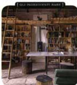
GLI INGREDIENTI RARI