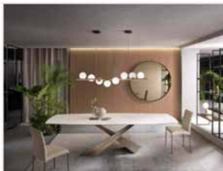
Living di Riflessi

Il tavolo allungabile Kenzo (Art. 892000 JA) in vendita da Leroy Merlin si estende grazie al sistema di apertura scorrevole. Il piano rettangolare è completamente realizzato in legno-MDF di alta qualità nella raffinata finitura rovere alaska con bordi in PVC; le gambe di colore bianco, con una forma massiccia, creano un piacevole contrasto. Misura L. 140/190 x P. 90 x H. 78 cm. Prezzo 217,20 euro. www.leroymerlin.it