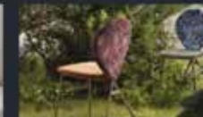
Colori d'autunno allegri malinconici