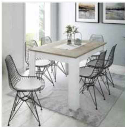
Kenzo (Art. 892000 JA) da Leroy Merlin

Il tavolo allungabile Kenzo (Art. 892000 JA) in vendita da Leroy Merlin si estende grazie al sistema di apertura scorrevole. Il piano rettangolare è completamente realizzato in legno-MDF di alta qualità nella raffinata finitura rovere alaska con bordi in PVC; le gambe di colore bianco, con una forma massiccia, creano un piacevole contrasto. Misura L. 140/190 x P. 90 x H. 78 cm. Prezzo 217,20 euro. www.leroymerlin.it