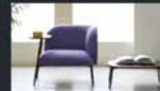
I consigli per una casa Very Peri