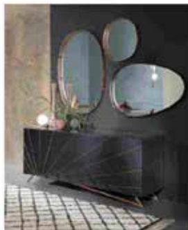
Moblie scostiture di design Solaris. Riflessi Lab. Ispirata ai raggi del sole, l'incisione a raggiatura color rosso si staglia su tutte le superfici a vista. (mar. 21)

Sostituirli equivale a rinnovare il volto dell'ambiente. Proprio per questo troviamo infiniti stili e modelli: con ante scorrevoli o a battente, aperti con ripiani a vista . Sospesi, effetto nuvola o dalle linee squadrate. Rigorosi o sinuosi.