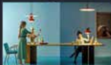
Le tende del nord tingono l'inverno