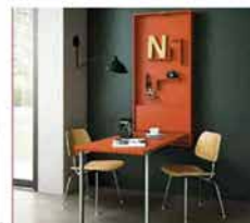
● Wally , tavolo e scrivania a muro, misure chiuse 71,8x153,5 cm. www.cle.it