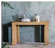
● Brooklyn , gestibile in diverse lunghezze, 120x52/300 cm. www.devinanais.com

SMART WORKING IMPROVVISO, OSPITI INASPETTATI, COMPITI IN CUCINA: AUMENTARE LO SPAZIO, SIGNIFICA PIÙ COMFORT