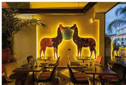
I. Riflessi_Mama Cocha

28/10/2021 - Riflessi customized the seats for Mama Cocha , a restaurant located in the Naples area specialized in a nikkei food and wine proposal, a synthesis between the Peruvian and Japanese culinary culture.