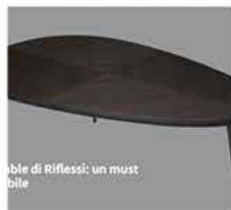
Il coffee table di Riflessi: un must irrinunciabile