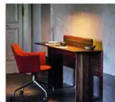
● Intra 3180 , raddoppiabile 180x42/80 cm con vano portaoggetti. www.bross-italy.com