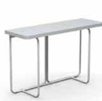
● Dee-J , allungabile, basamento e piano in 3 finiture, 120x40/80 cm. www.connubia.com