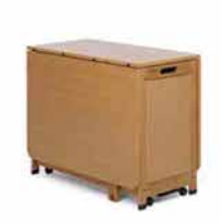
● Copernico , può contenere 6 sedie, 91x46/107/168 cm. www.foppapedretti.it