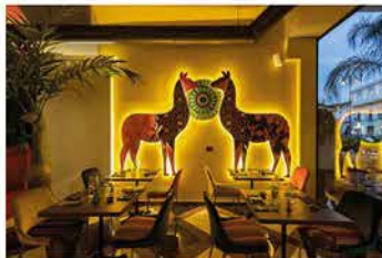
S. Riflessi, Mama Cocha

28/10/2021 - Riflessi customizza le sedute di Mama Cocha, ristorante in provincia di Napoli specializzato in una proposta enogastronomica nikkei, una sintesi tra la cultura culinaria peruviana e quella giapponese.