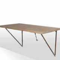
● Tavolo a muro in legno con piano a ribalta, misure 120x61 cm. www.cinlus.com