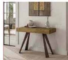
● Panaché , dotata di 3 allunghe (una esternal 111,5x50/95/140/185 cm. www.easy-line.it