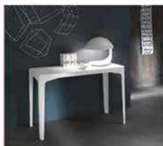
● Corner , allungabile, disponibile in diverse finiture e dimensioni. www.riflessi.it