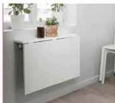
● Norberg , Tavolo ribaltabile da parete, bianco 74x60 cm. www.ikea.com