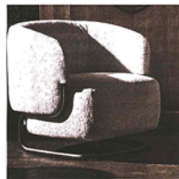
Cocktail Un mix di equilibrio e funzionalità per la poltroncina Marabu di Paolo Grasselli per Ditre Italia