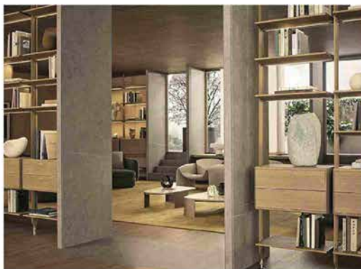
Cabina Lexington, progettata da Poliform e Jean-Marie Massaud