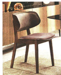
Cinquanta in forma Con struttura in legno, Gisele è la nuova sedia di Riflessi che ricorda il design anni Cinquanta