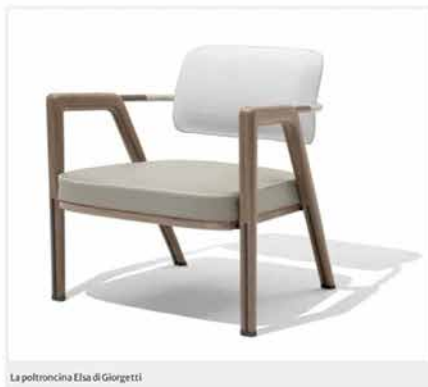
La poltroncina Eisa di Giò Ponti

Legno certificato FSC®, proveniente da foreste gestite secondo rigorosi standard ambientali, sociali ed economici, per la struttura della sedia Gisele di Riflessi: è caratterizzata da una linea morbida e dolce che si ispira al passato e la rende comoda ed elegante allo stesso tempo. Le venature del legno impreziosiscono la superficie e mettono in risalto la colorazione dei rivestimenti. www.riflessi.it - Fuorisalone, Riflessi store, Piazza Velasca 6, Milano