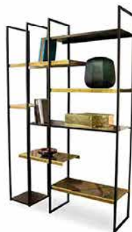
Libreria Freewall di Riflessi

Freewall di Riflessi è un sistema componibile dal mood vintage che presenta uno schema fisso ed è disponibile in due dimensioni. Il primo modulo è stato concepito come una libreria che può essere posizionata sia a parete sia come divisorio per separare gli ambienti in modo discreto mentre il secondo come un raffinato appoggio per un retro divano. La composizione ha una struttura metallica snella verniciata in grafite, impreziosita da mensole in ottone spazzolato a mano che le conferiscono un fascino senza tempo.