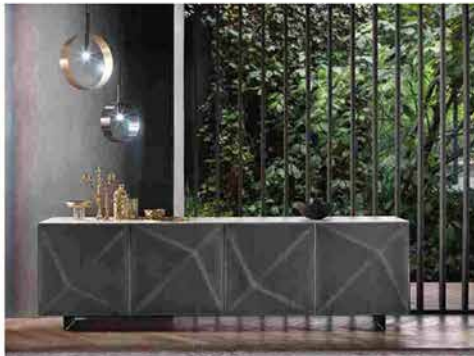
Cubric by Riflessi. Ispirazione metallo.