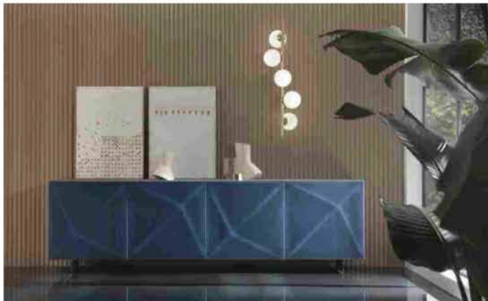
Riflessi, madia 'Cubric', finitura Cobalto

Per il nuovo anno, la serie 'Cubric' si rinnova con due finiture di ispirazione metallica per i mobili contenitori protagonisti dei living a firma Riflessi . New entry della collezione, inoltre, la madia in versione quadrotto che va ad ampliare una delle serie più apprezzate del catalogo dell'azienda.