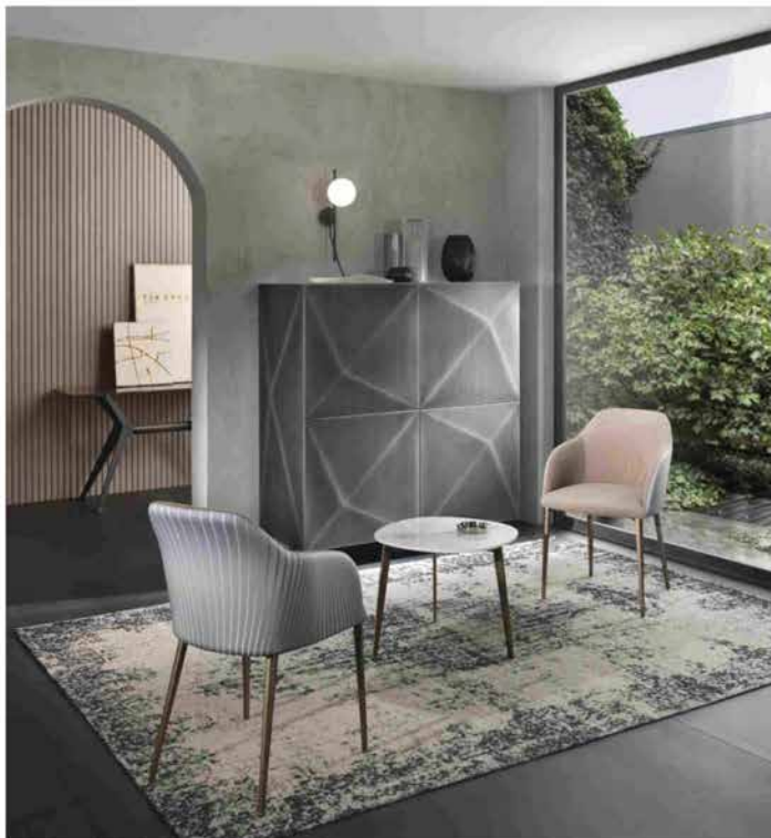
Riflessi, madia 'Cubric', versione quadrotto, finitura Titanio

Una volta aperti, i mobili rivelano interni rivestiti in legno noce Canaletto, personalizzati con ripiani in cristallo trasparente e cassetti opzionali.