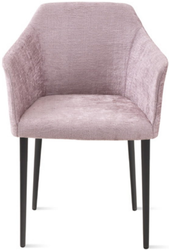
sedia modello Carmen